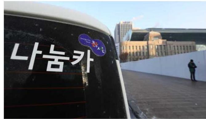
▲ [사진= 뉴시스]

카셰어링을 이용하는 2030대가 증가하면서 최근 오피스텔 단지 내 카셰어링 서비스를 도입하는 곳이 늘고 있다. 이는 주택 구입 시 카셰어링의 도입 여부를 중요하게 생각하는 수요자들이 늘어났기 때문이다.